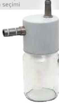
Aşırı akımı önleyici şamandıra seçimi