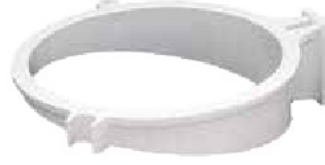
2L kavanoz için destek çemberi