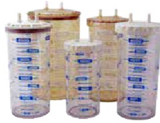
0,5 - 4 l polycarbonat ve polysulfon aspiratör kavanozları