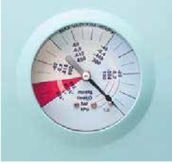
Renk kodlu Vakum göstergesi