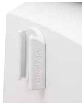
Ekstra kavanozlar için tutamaç