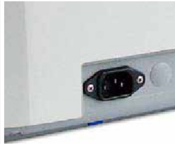
IEC güç çıkışı ünitesi