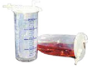
Disposible torba kavanoz MONOKIT