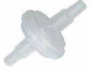
MSF mikrobiyolojik vakum filtresi